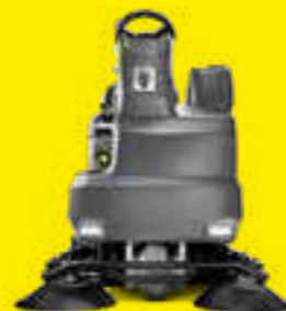
Schrob-/zuigmachines pagina 12-15