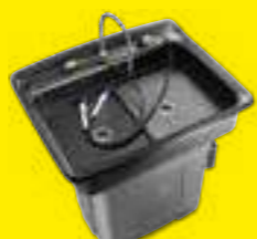
Onderdelen reiniger pagina 20