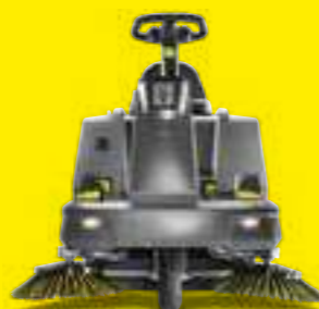
Veeg-/zuigmachines pagina 16-19