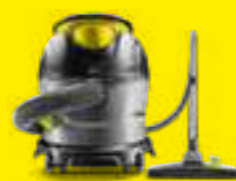
Stofzuigers pagina 4-5

Wij van Kärcher ontwikkelen voortdurend producten waarmee u sneller, eenvoudiger en efficiënter uw reinigingstaken kunt uitvoeren. Of het nu gaat om het verwijderen van vlekken uit het tapijt, schoonmaken van kunstgrasvelden of het opzuigen van grote hoeveelheden vloeistoffen, wij bieden tal van innovatieve reinigingsoplossingen. Elke dag opnieuw zorgen wij ervoor dat onze klanten het WOW gevoel mogen ervaren bij het uitvoeren van hun reinigingstaken.