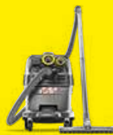
Stof-/waterzuigers pagina 6-9